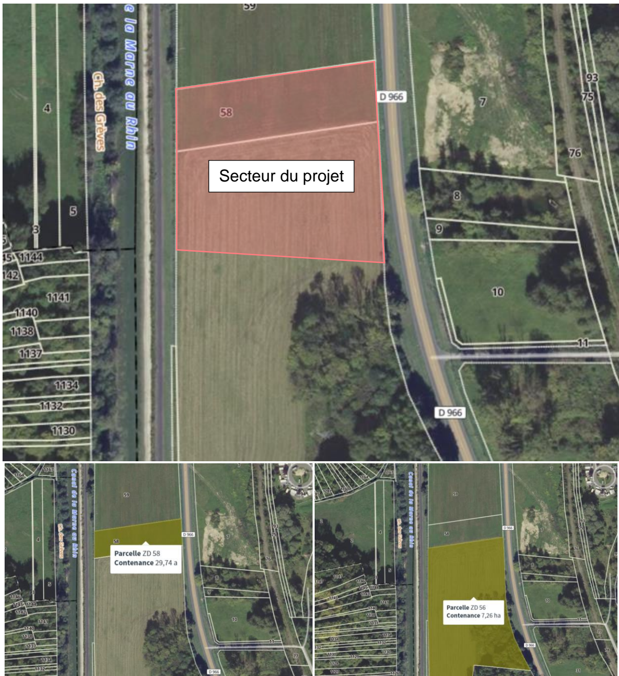
Localisation du projet d'aire d'accueil à l'échelle parcellaire

La zone du projet est actuellement classée en zone 1AUY (zone à urbaniser à vocation économique). Elle est reclassée, dans la procédure, en zone 1AUCv.