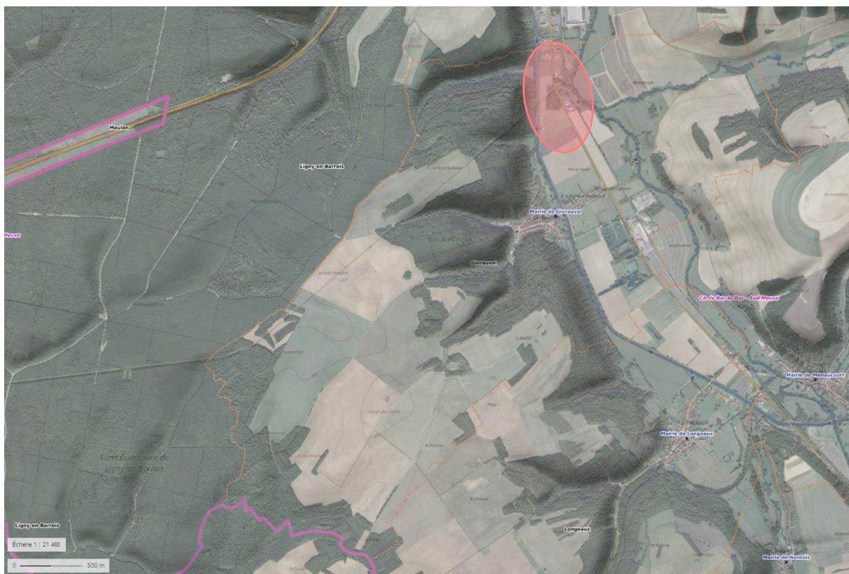
Localisation du projet d'aire d'accueil

L'aire d'accueil des gens du voyage s'implantera au nord du territoire communal.